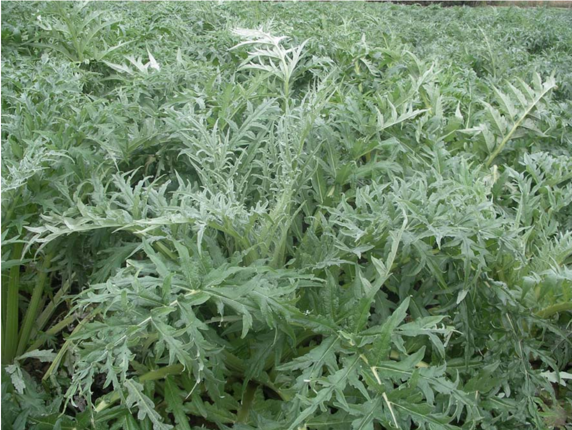
VERDE DE PERALTA