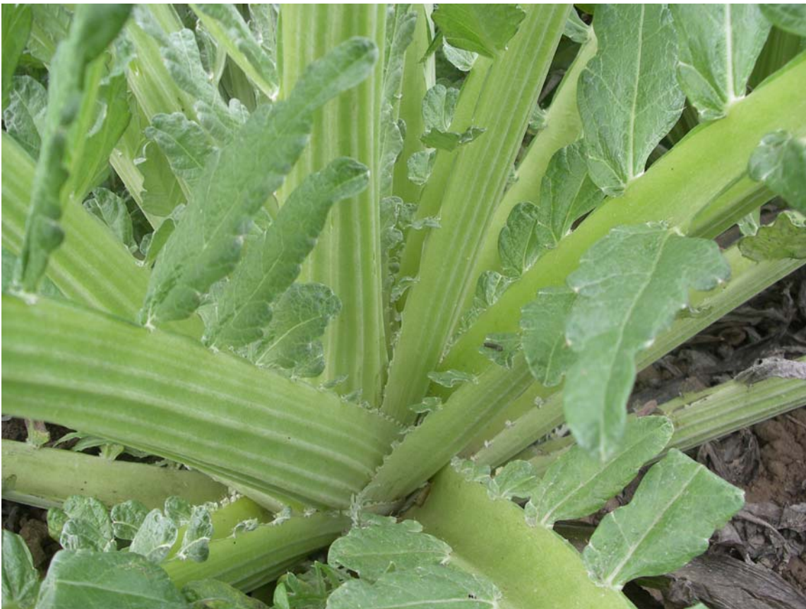
PENCA DE CARDO VERDE