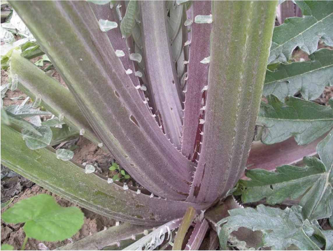
PENCA DE CARDO ROJO