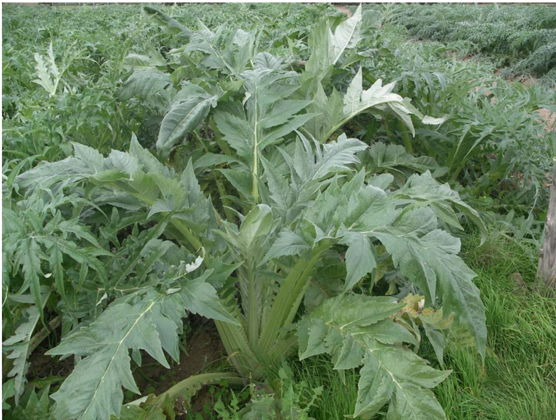
CARDO DE HOJA ANCHA