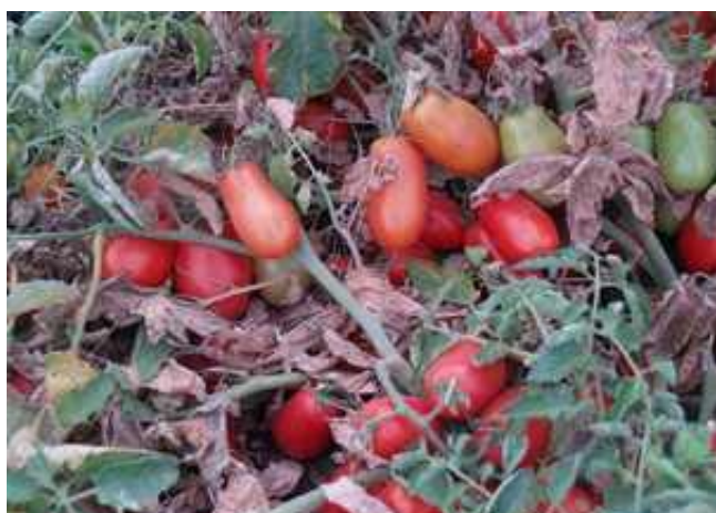
Gades (ES.68-02) (Esasem)