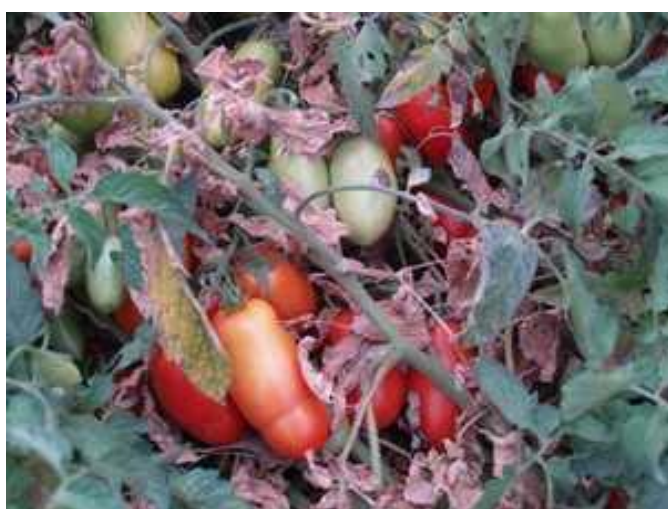
Rosso Delta (Akira)