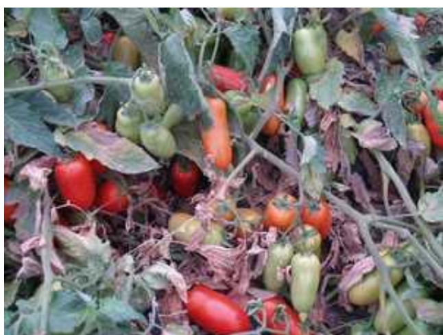
Gladis (ES.66-02) (Esasem)