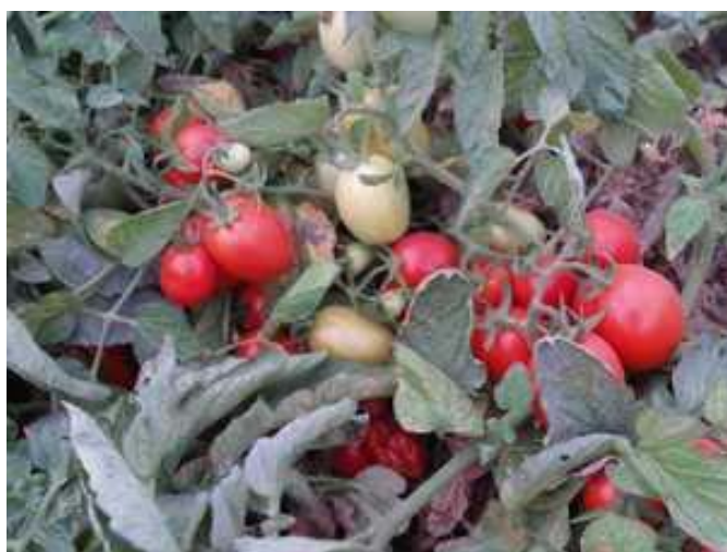
Litano (CLX-38138) (Clause)