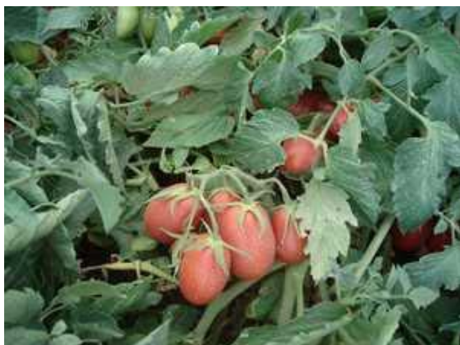
Auspicio (CLX-38113) (Clause)