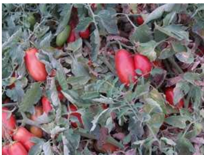
Num 0108 (Nunhems)