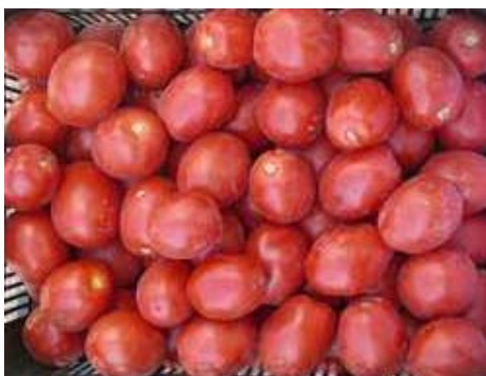
Top 67 (Intersemillas)