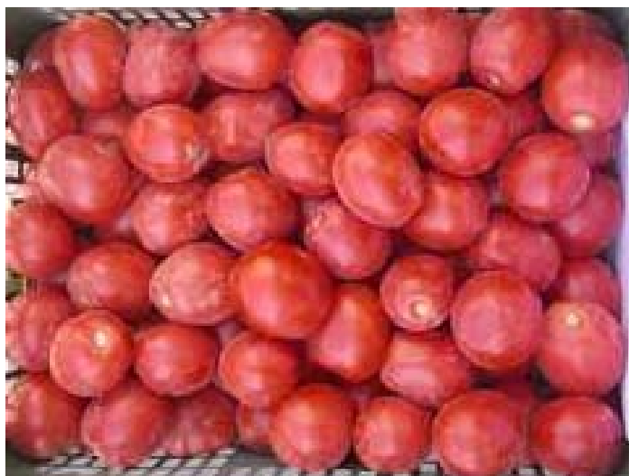
Everton (ISI-24458) (Diamond)