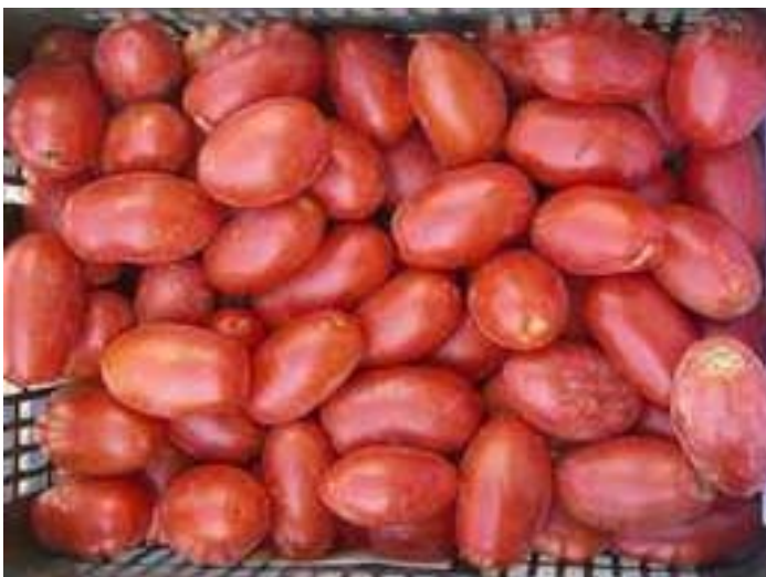
Ercole (Syngenta) TESTIGO