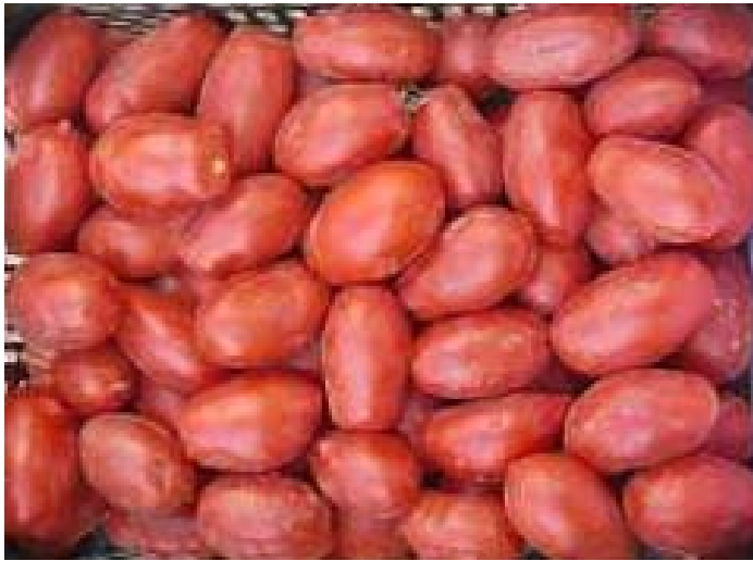
Gades (ES.68-02) (Esasem)