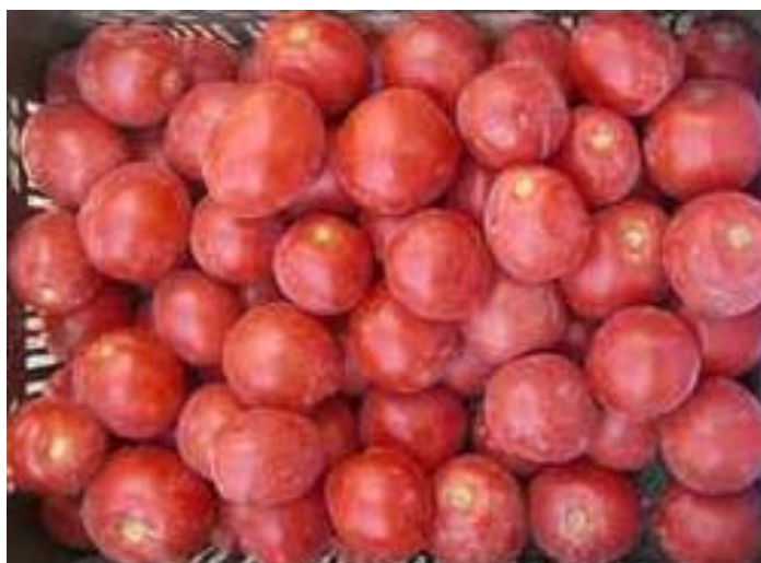
Red Sky (Nunhems)