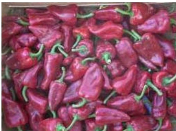
Arca (R. Arnedo)