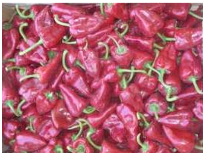
Piqram (R. Arnedo)