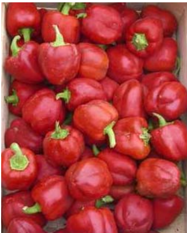
Cierzo (R. Arnedo)