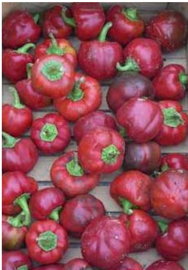
Bola Puente (Agricultor)