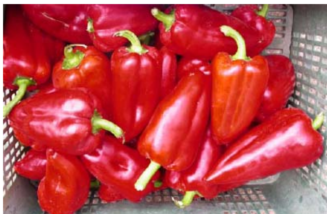
Corera (R. Arnedo)