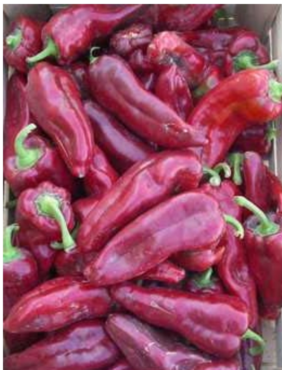
Adriático (Jad Ibérica)