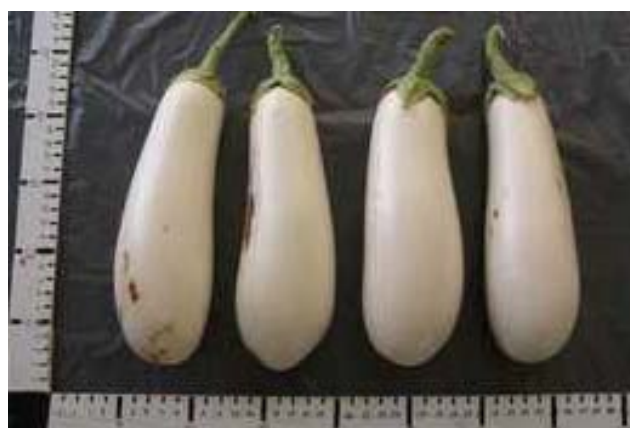
DSX-08014 (Diamond) (Blanca)