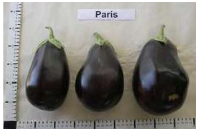
Paris (Calanda) (R. Arnedo)