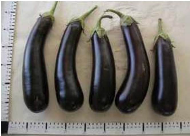
Nilo (Rijk Zwaan)