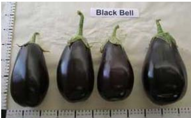
Black Bell (Seminis)